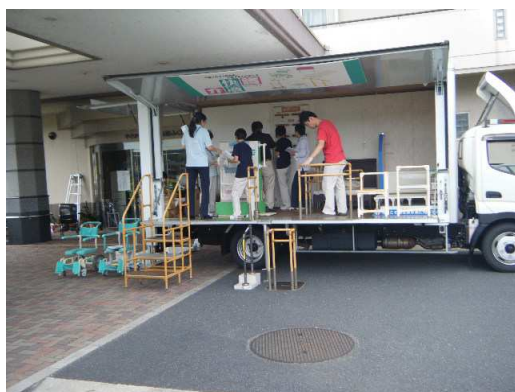
訪問施設での風景です。