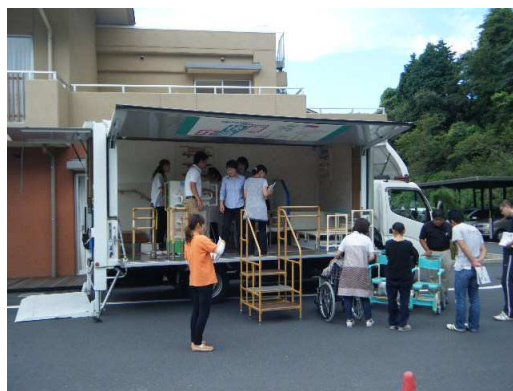
訪問施設での風景です。