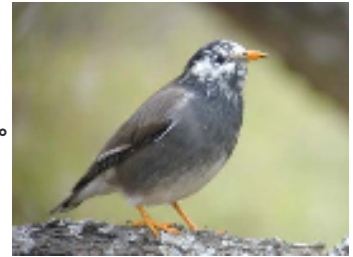
↑これがムクドリです。

今年はムクドリも仕事場に巣を作っています。これはツバメよりかなり体も大きく、鳴き声も大きいです。親鳥とひな鳥で三匹います。ちょうど、私の長女の家族が三人なのですが、その家族と重なり微笑ましく感じています。ツバメもムクドリも可愛いのですが、フンを下に落とし、材木や車が汚れてしまうので、頭がいたいです。