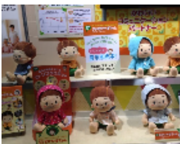
「おしゃべりかぼちゃん」の 仲間たちです！