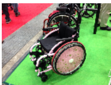
子供さん用の車いすが、目に留まりました。 軽くて使い勝手が重視されています。