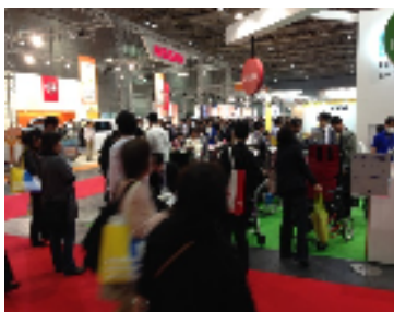
ひと・ひと・ひと・・・ いっぱいの人です。

残念ながら今回参加を見送られた方も、次の機会には是非、ご一緒できますように、ケアすぎけんスタッフ一同お待ちしております。