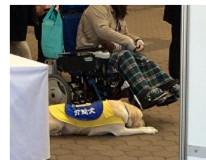
けなげに指示を待つ、介助犬君。頑張ってください！心の声をかけます。