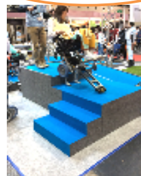
階段を昇降できる車イスです。驚きです！