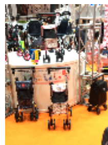
可愛い歩行器でお出かけが楽しくなりますね。

今年で4回目の「ケア・すぎけんバスツアー」総勢32名での参加となりました。たくさんのご参加ありがとうございました。今後活かしていきたいと思っております！今回、ご都合がつかなかった方も、次回は是非ご参加ください！