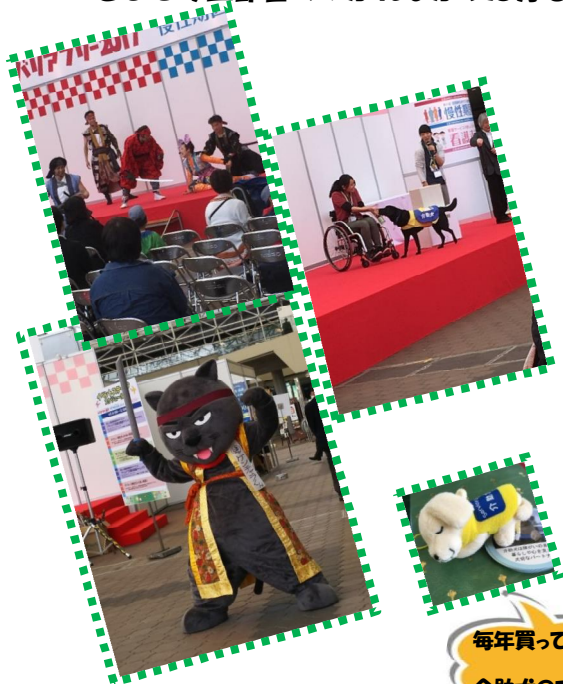
毎年買ってもらう 介助犬のマスコット