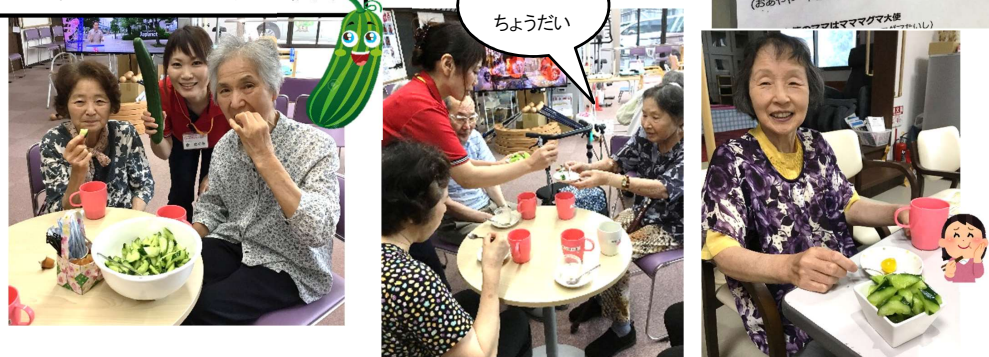
畑で取れたキュウリの浅漬けを試食

フレーズがおもしろい早口言葉 笑ってしまうような面白いフレーズの早口言葉を集めました！ レモンとメロンとルミオンとルミオロメン (レモンとメロンとルミオンとルミオロメン) 右耳にミニニキビ (みきみに、ミニニキビ) ブラジル人のミラクルピラ配り (ブラジル人の ミラクルピラくぱり) プスパスガイドのバスカス爆発 (プスパスガイドのバスカスぱくはつ) バナナの腰はまだ腰だぞ (バナナのなぞは まだなぞなのぞ) よほよほ病 (よほよほびょう) お線や、八面におあやまり (おあやや やおやにおあやまり) ママママママ